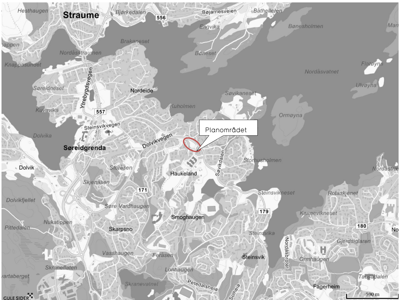
Kart som viser planområdets beliggenhet